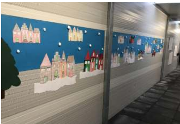
Het winterlandschap in de Sluis

De bewoners van Het Knooppunt hebben sfeervolle winterhuizen uitgeknipt en deze kleur gegeven. Met elkaar hebben zij op die manier een echt knus winterlandschap gecreëerd met huisjes en sneeuw. Ergens begin maart, zal het winterlandschap omgetoverd worden naar het nieuwe jaargetij. Dat belooft wat. Wij kijken er in ieder geval nu al erg naar uit.