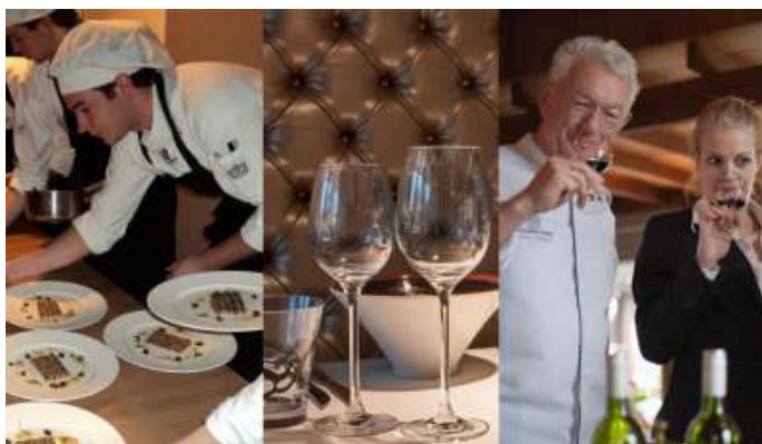
Restaurant van ROC Twente