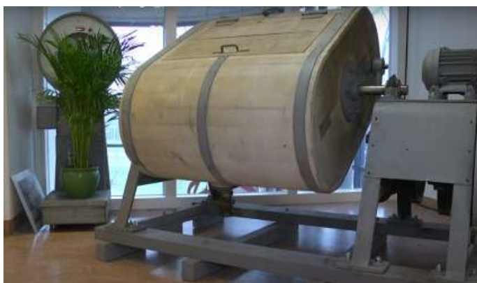
Museum MST - oude wasmachine van 1924