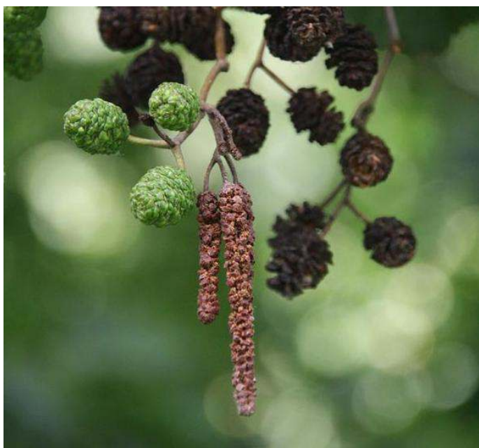
Mannelijke katjes zwarte els

De natuur weerspiegelt het naderende voorjaar. Na de grauwe els komt ook de zwarte els in bloei. Beide dragen in de eerste helft van maart lange, stuivende katjes. Begin maart kunnen ook de katjes van de grauwe populier al gaan bloeien. Bij de mannelijke katjes komen dan de purperrode meeldraden tussen het grauwe dons naar buiten. De wilgen dragen zilverwitte, fluweelzachte katjes; het zal echter tot de tweede helft van maart duren voordat zij echt in bloei komen en de eerste insecten trekken.